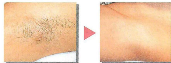
〈ワキ：治療前/治療後〉